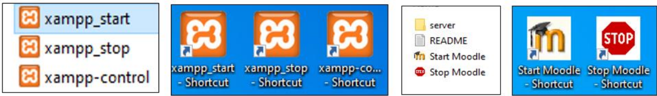
სურ. N1- xampp და moodle იკონები მონიტორზე

სტანდარტულად და ასევე ჩვენი შემთხვევისათვის Moodle LMS გარემოში შექმნილი ინფორმაცია ფაილები შეინახება ლოკალურ მისამართზე